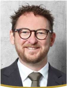
Thomas Henk Leiter LLB Deutschland AG